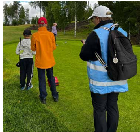
Pirkanmaan junnutourilla pelaajien mukana kulkee aikuisia pelinohjaajina