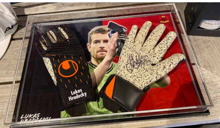
Huutokaupassa oli myös Huhkajien maalivahti Lukas Hradeckyn hanskat nimikirjoituksella

Pro-Am tapahtuman hyväntekeväisyyshuutokaupassa oli huudettavana ainutlaatuisia urheilutuotteita