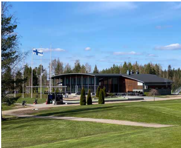
Kenttä vihersi ja aurinko paistoi kauden 2024 avauspäivänä torstaina 9.5.