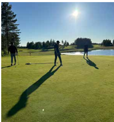
Samppanja Golfissa nautittiin täydellisestä kesäilmasta