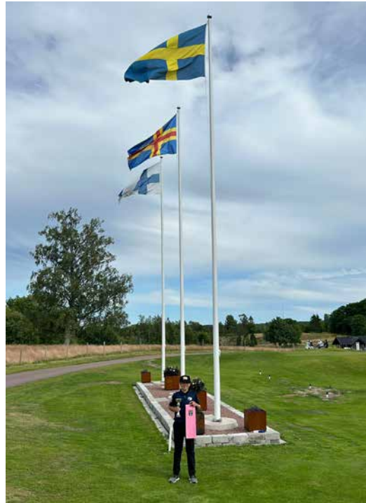
Rory Ojala voitti Ahvenanmaalla pelatun Future Tourin kilpailun

Golf Pirkkalan Rory Ojala sijoittui toiseksi valtakunnallisella Dormy Future tourilla Easy Red U-12 sarjassa. Rory pelasi kauden aikana 14 Future tourin kilpailua ja voitti niistä peräti kuusi. Top 10 sijoitus tuli jokaisessa neljässätoista kilpailussa.