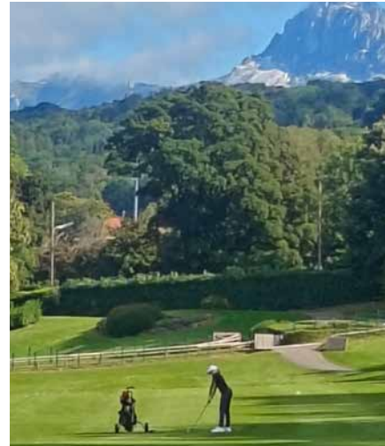
Henni Evianin kentän väylällä 10