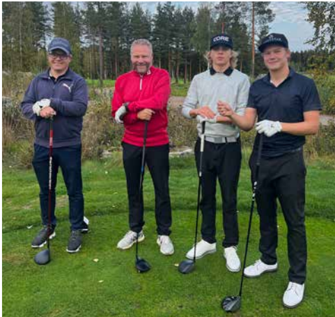
Kauden päätöspelit aikuiset vastaan juniorit