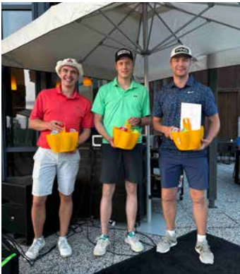
Bufferin iltapäiväkisan kakkosjoukkue Team Kauhanen