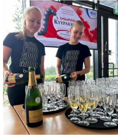
Samppanja Golf aloitettiin yhteisellä kilistyksellä