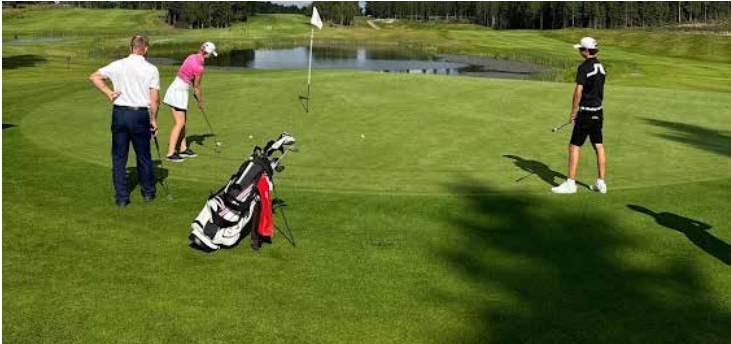
Bufferi Openin päivä oli täydellisen aurinkoinen ja lämmin

Heinäkuussa oli Bufferi Openin vuoro ja kenttä täyttyi jälleen koko päivän osalta kahden yhteislähdön verran. Aamulla aloitettiin kisaamalla kahden henkilön scramble ja iltapäivällä jatkettiin toinen scramble kolmihenkinen joukkuein. Vain pelaajat vaihtuivat kilpailuiden välillä. Mukana tapahtumassa oli yhteensä 246 pelaajaa! Tapahtuma huipentui Ravintola Bufferin terassille palkintojenjakoon, hyvään ruokaan ja juomaan sekä Reino Nordin hienoon keikkaan.