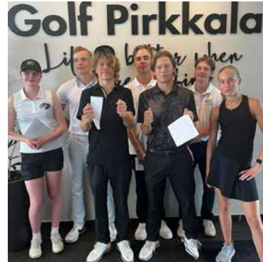
U18 ja U16 tytöt & pojat